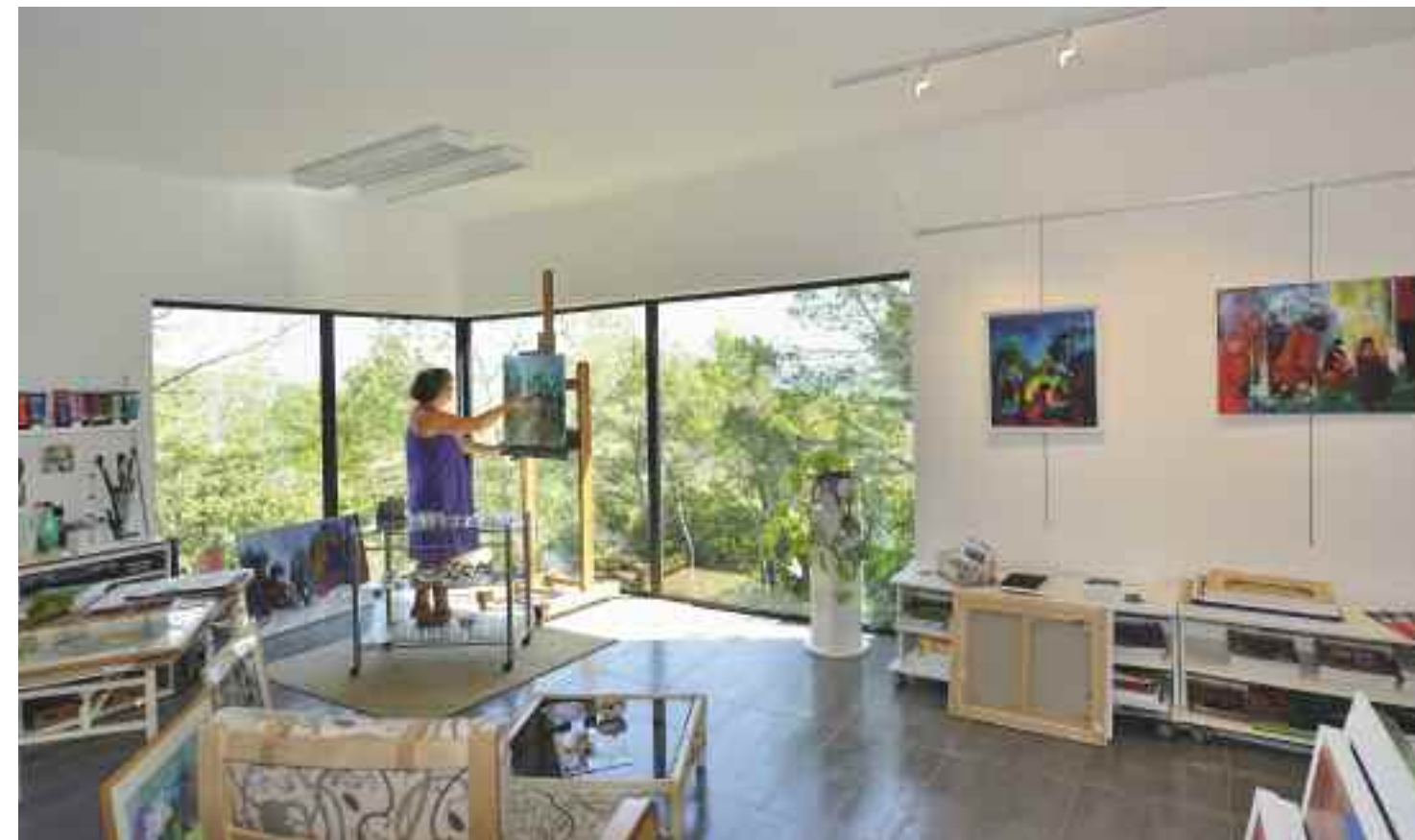
« La peinture très expressive de Claude Bertrand est puissante, sans violence, figurative, sans excès, hardiment colorée, sans agressivité. D'instinct, elle retrouve le caractère essentiel de toute chose, organise ses volumes, répartit la lumière qu'elle veut tantôt ardente ou tantôt voilée. » Son atelier tutoie la cime des arbres et bénéficie de la luminosité idéale.

naturel et limitent les travaux de terrassement. Implantée juste à la rupture de pente, elle offre ainsi une composition originale. Côté sud, elle s'ouvre généreusement le long d'un bassin de nage, avec un grand deck en ipé qui crée de fortes relations entre intérieur et extérieur et favorise les apports solaires directs. Les modules du hall d'entrée et des chambres accentuent la protection contre le vent. Côté nord, c'est la carte « belvédère en forêt » qui a été développée ! Plutôt qu'une longue façade uniforme, la composition en trois modules procure une séquence visuelle tout à fait originale et spectaculaire. L'atelier, le séjour et la chambre principale sont chacun dotés d'angles de verre orientés au nord-ouest. Avec la belle lumière du nord, l'artiste peut vivre et peindre dans les arbres !