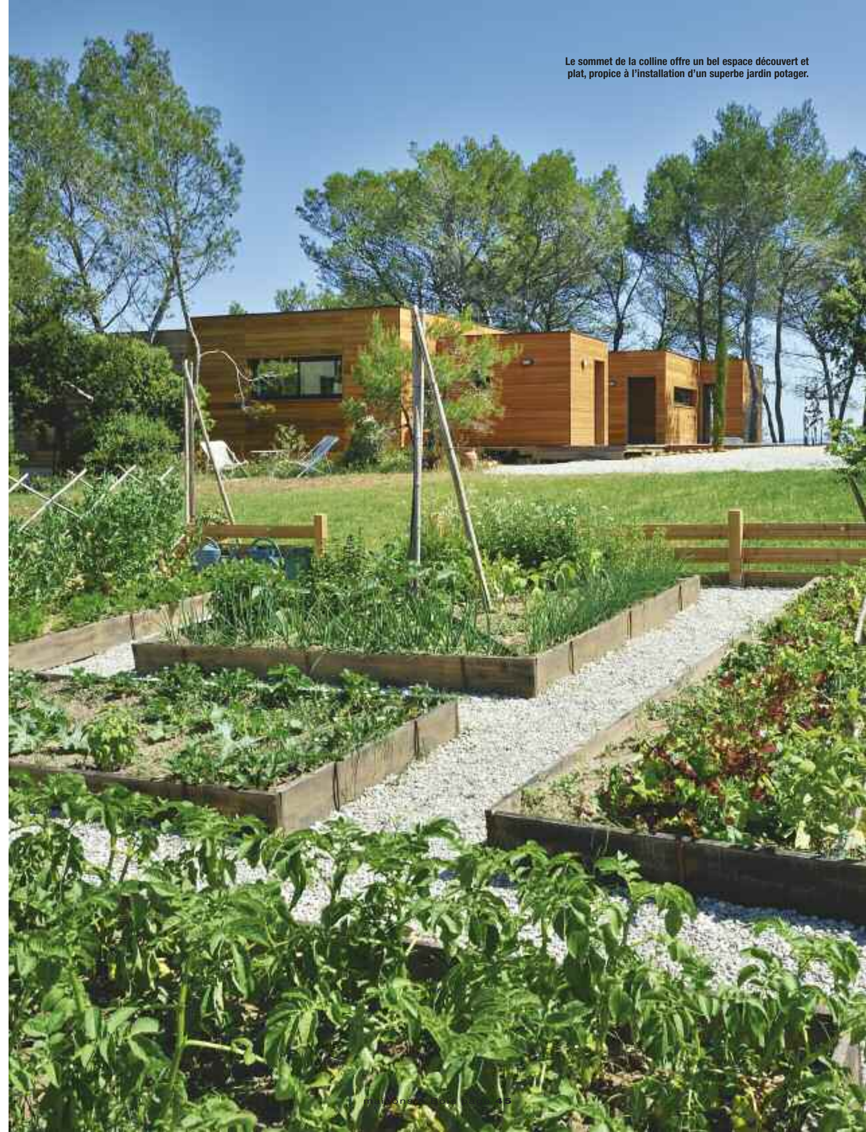
Le sommet de la colline offre un bel espace découvert et plat, propice à l'installation d'un superbe jardin potager.

l'impact visuel est minime, car la maison est cachée par une végétation largement préservée. La démarche environnementale était l'une des priorités de ce projet. Outre les aspects d'intégration discrète dans le site, la demeure est posée pour une bonne part sur des pilotis qui conservent le sol