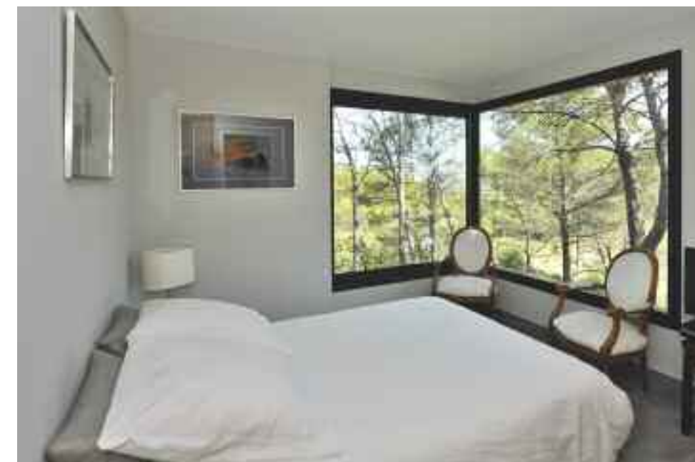
On retrouve le troisième angle de verre dans la chambre principale. Menuiseries à châssis fixe en alu et double vitrage.

Pour son faible impact environnemental, le bois s'est invité à plus d'un titre dans cette construction. Il fournit toute la structure porteuse et l'isolation thermique en laine de cellulose. 30 cm de cette matière totalement naturelle sont insufflés dans les murs ou assemblés en panneaux semi-rigides pour le plancher et le plafond une toiture plate revêtue d'une membrane PVC qui attend sa couche de terre végétale pour accroître l'inertie de la maison. Les parements extérieurs sont en mÉRanti, posé à claire-voie Le calpinage dénote une grande finesse, avec des lignes à la verticale des ouvertures et un habillage en lattes pour le module d'entrée. Grâce à toutes les baies vitrées, à galandage ou en châssis fixe, et les multiples fenêtres, la nature s'invite en permanence dans toutes les pièces de vie.