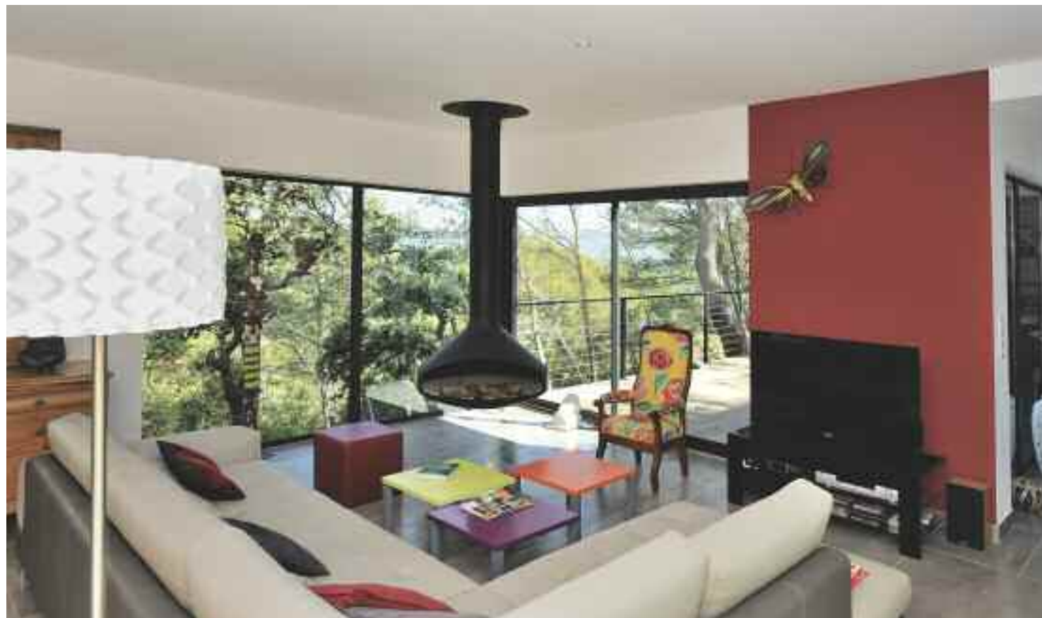
La composition architecturale en plusieurs volumes a permis de créer trois angles de verre coté nord qui optimisent les vues. Le salon occupe la partie centrale du bâti et se prolonge par des terrasses sur ses deux côtés.

Un jeu de hauteurs différentes de plafond marque les fonctions dans la grande pièce centrale de cette maison de 157 m 2 habitables.