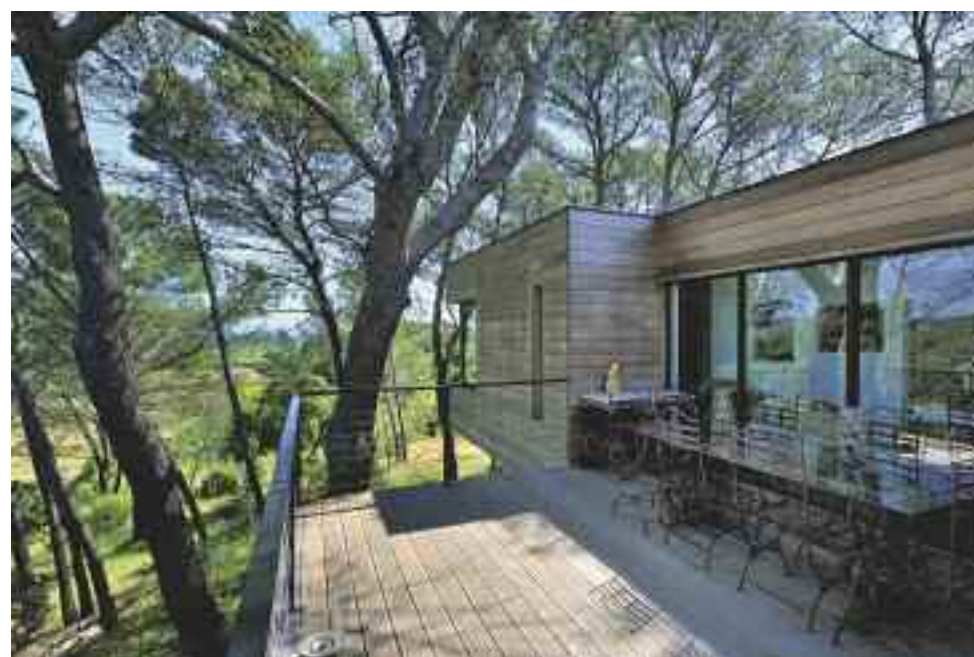
Pente abrupte et vue panoramique pour ce versant nord où les arbres se penchent sur la maison pour la protéger et la cacher.